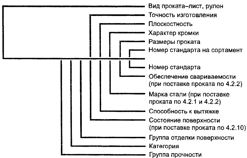
Схема условных обозначений проката

Примечание — При отсутствии указания какого-либо из параметров его выбирает предприятие-изготовитель.